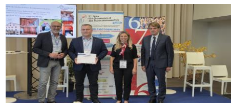
Remise du Prix départemental 2025 au Maire de GERSTHEIM